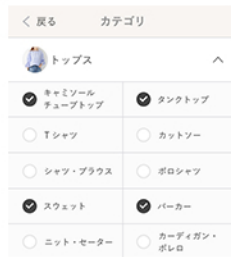
複数カテゴリ選択