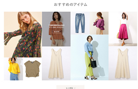
PC画面：モールドトップレコメンドアイテム

従来の商品軸に加え、一人一人に合わせた Recommend を表示できるようになり、より、お客様に最適な商品をご提案いたします。