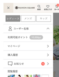
スマホ画面：メニューお知らせ機能

気になるアイテム、ショップのお得情報や購入商品の配送状況などのお知らせが一目でわかるようになります。